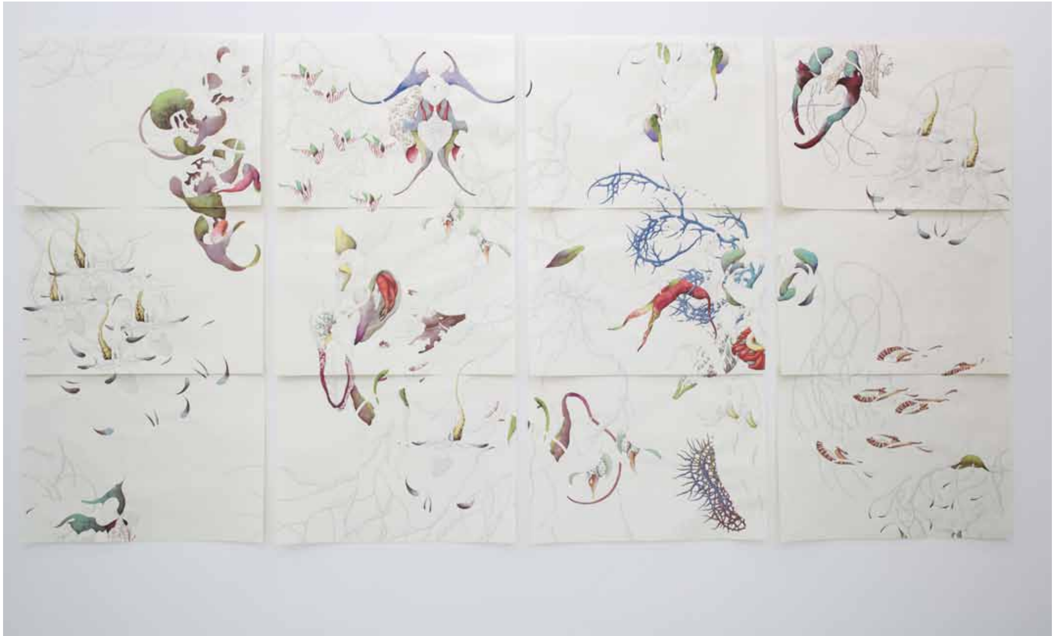
As You Desire Me, 2011, 12 parts, pencil, Indian ink, watercolour on paper, each 96 x 66 cm. Installation view at MANZONI SCHÄPER