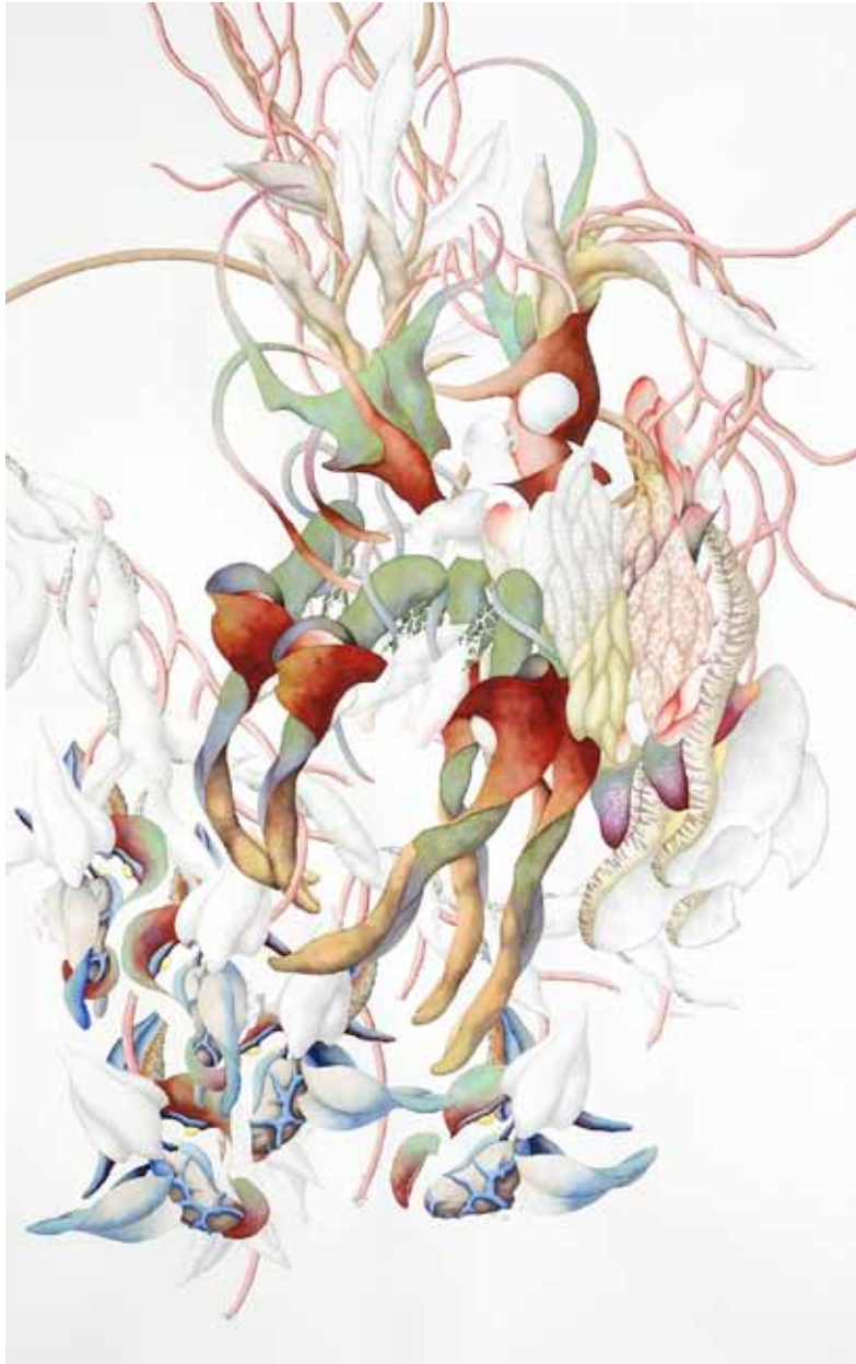
Untitled, 2011, pencil, Indian ink, watercolour on cardboard, 140 x 87 cm