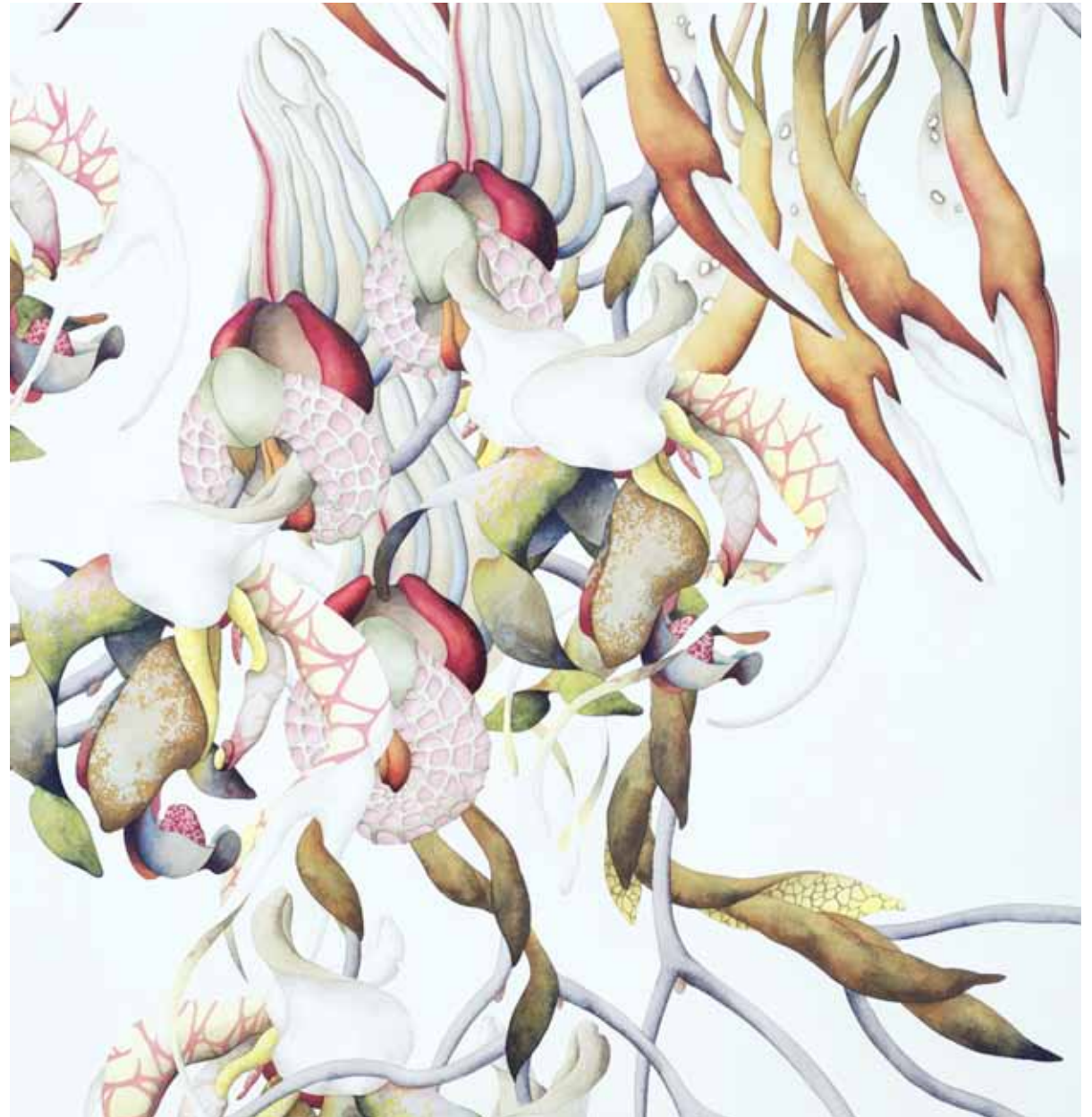
Untitled, 2011, pencil, Indian ink, watercolour on cardboard, 103 x 74 cm. Handmade, goldcoated frame