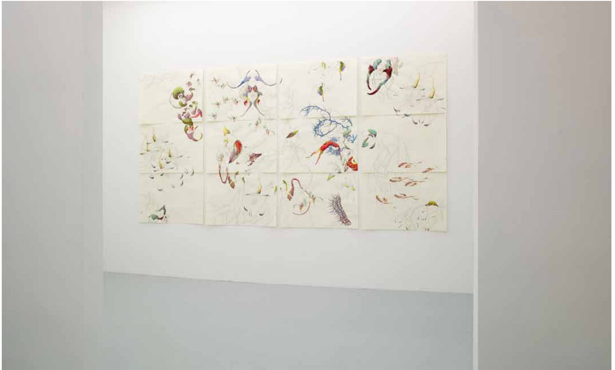
As You Desire Me, 2011, 12 parts, pencil, Indian ink, watercolour on paper, each 96 x 66 cm. Installation view at MANZONI SCHÄPER