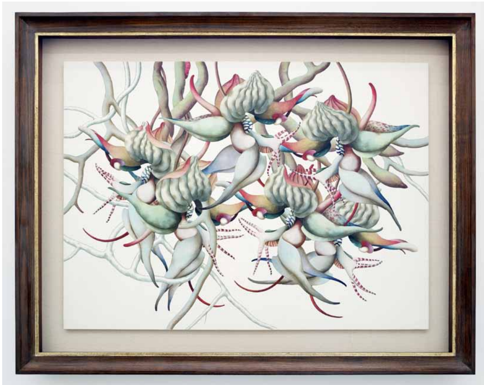
Untitled, 2011, tempera on canvas on wood, 55 x 75 cm Framed: 72 x 92 cm